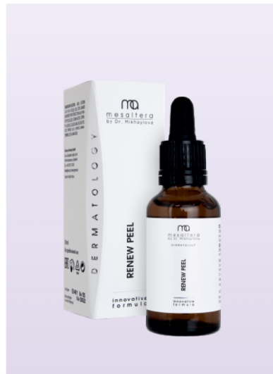
RENEW PEEL | 30 ml

Maska peelingująca wspomaga głębokie oczyszczanie skóry i usuwa zaskórniki. Ze względu na zawartość kwasu glikolowego ma wyraźne działanie złuszczające, wygładza i rozjaśnia skórę oraz sypłca zmarszczki. Kolagen i elastyna wspomagają szybką regenerację skóry. Kompleks ekstraktów roślinnych zapewnia efekt kojący, zmiękczejący i tonizujący.