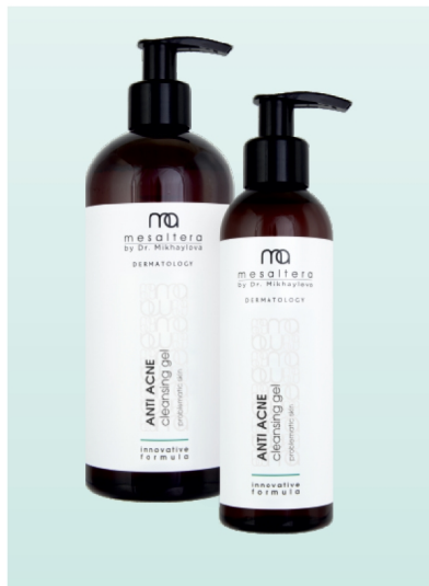
ANTI ACNE Cleansing gel 200 ml | 400 ml