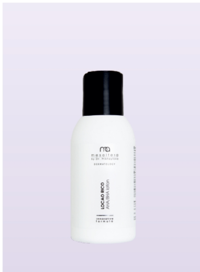
LOCAO RICO AHA/BHA lotion | 100 ml