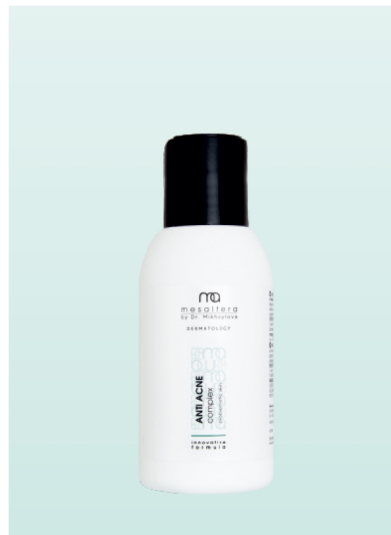
ANTI ACNE Complex | 100 ml

Przeznaczony do oczyszczania, tonizowania i pielęgnacji skóry tłustej i problematycznej z trądzikiem. Kwas salicylowy zapewnia działanie złuszczające, zmiękcza zaskórniki. Ac.Net™ Complex™ blokuje powstawanie trądziku i zaskórników oraz zwalcza nadprodukcję sebum. Kompleks Trikenor™ Plus posiada właściwości antybakteryjne i łagodzące. Pantenol i alantoina nawilżają, zmiękcżają i łagodzą podrażnienia, wspomagając odnowę skóry. Nie zawiera alkoholu i nie wysusza skóry.